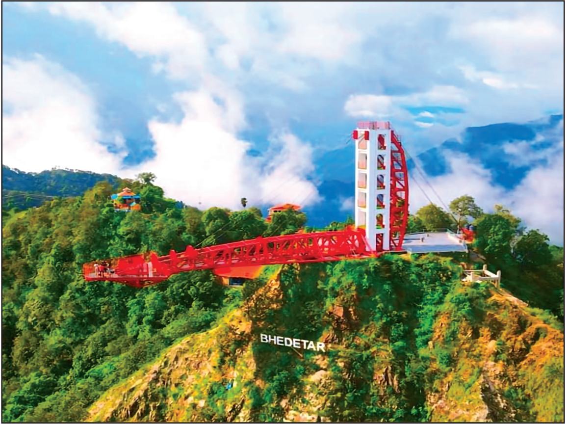
भेडेटार, धनकुटामा सार्वजनिक निजी साझेदारी मोडलमा निर्मित भेडेटार स्काइ वाक ।