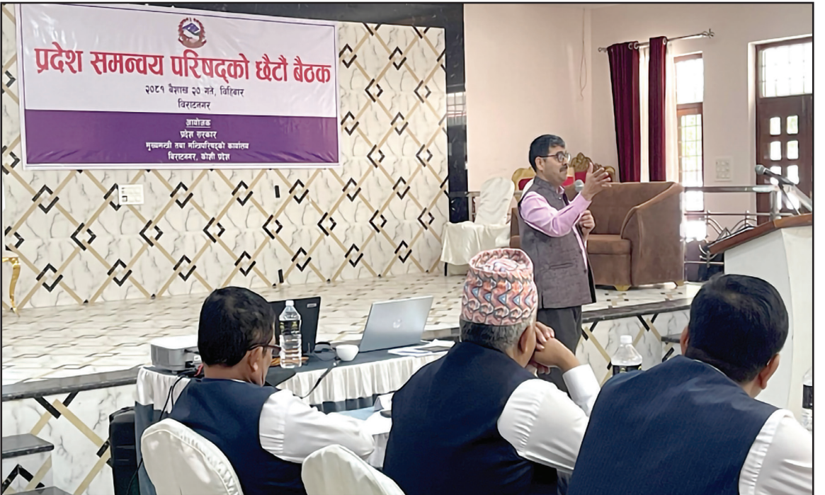
मिति २०८१/०९/२० गते विराटनगरमा सम्पन्न प्रदेश समन्वय परिषदको छैटौँ बैठक