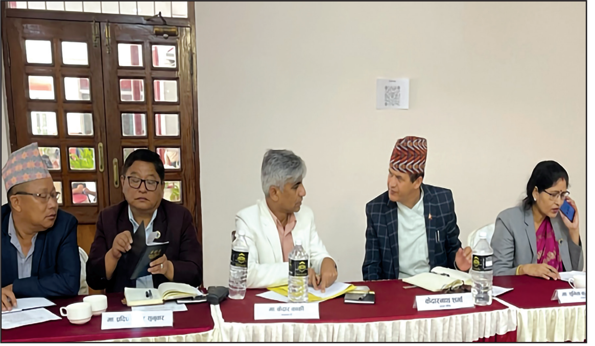
सगरमाथा दिवस कार्यक्रमका सम्माननीय प्रधानमन्त्री पुष्पकमल दाहाल एवम् माननीय मुख्यमन्त्री हिक्मत कुमार कार्की ।