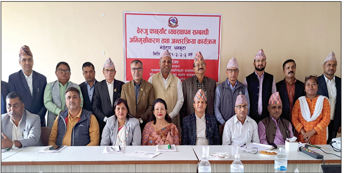
वेरुजु फर्स्यौट सम्बन्धी अभिमूखीकरण कार्यक्रम भेडेटार धनकुटा